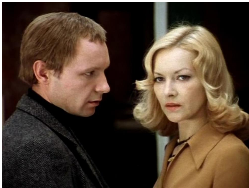
Андрей Мягков и Барбара Брыльска - в фильме «Ирония судьбы или с легким паром»

«Лучше уйду из театра, чем сыграю Ленина»