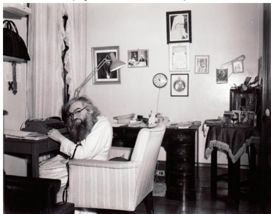
Святитель Иоанн в своей келье в Сан-Франциско

Обращаясь к истории и прозревая будущее, свт. Иоанн говорил, что в смутное время Россия так упала, что все враги ее были уверены, что она поражена смертельно. В России не было царя, власти и войска. Люди «измалодушествовали», ослабели и спасения ждали только от иностранцев, перед которыми заискивали. Гибель была неизбежна. В истории нельзя найти такую глубину падения государства и такое скорое, чудесное восстание его, когда духовно и нравственно восстали люди. Такова история России, таков ее путь. Последующие тяжкие страдания русского народа есть следствие измены России самой себе, своему пути, своему призванию. Россия восстанет так же, как она восстала и раньше. Восстанет, когда разгорится вера. Когда люди духовно восстанут, когда снова им будет дорога ясная, твердая вера в правду слов Спасителя: «Ищите прежде Царствия Божия и Правды Его и вся сия приложатся вам» .