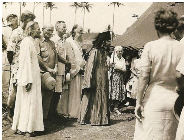
Святитель Иоанн посещает лагерь русских беженцев на Тубабао

причин для беспокойства нет, поскольку «ваш святой человек благословляет ваш лагерь каждую ночь со всех четырех сторон». Когда же лагерь был эвакуирован, страшный тайфун обрушился на остров и полностью уничтожил все строения.