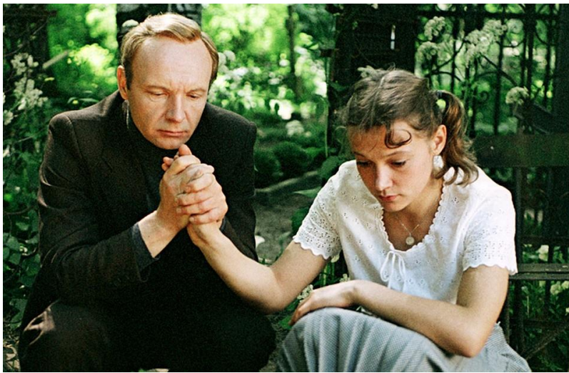
А. Мягков более полувека состоит в браке с актрисой Анастасией Вознесенской.

Именно Вознесенская первой стала звездой: сразу после учебы сыграла большую роль в фильме «Майор Вихрь», была приглашена в труппу театра «Современник». Мужа взяли в ту же труппу «в нагрузку», по словам Эльдара Рязанова. В кино ему сначала не очень везло: первый же фильм, «Похождения зубного врача» Элема Климова, вышел очень ограниченным тиражом, а потом и вовсе был снят с экранов. Но «Похождения...» заинтересовали мэтра советского кино Ивана Пырьева, и вскоре Мягков получил свою первую звездную роль – Алеши в его «Братьях Карамазовых». И популярность Вознесенской в лучах славы мужа постепенно начала меркнуть. Что, впрочем,